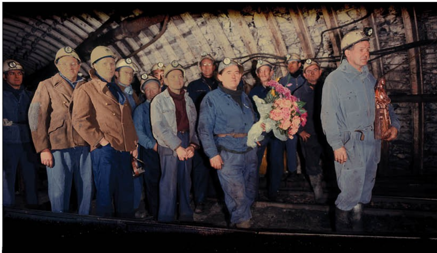
Célébration de la Sainte-Barbe, Fosse Agache - Fenain, années 1970